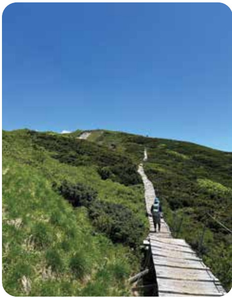
頂きまであともう少し!

私が登山を始めて、早いもので三年が経ちました。きっかけは日々の忙しさを少しでも忘れ、リフレッシュしたいという些細な思いからでしたが、今では月に二回ほど、ソロや山の会の仲間と共に山を歩くことが、私にとって欠かせない生活の一部となっています。