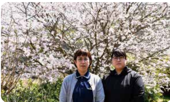
これからも寄り添う支援を

づくりのお手伝いをしています。「相談してよかった」と感じていただけよう、身近な存在として寄り添うことを心がけています。また、地域の皆さまが気軽に参加できる介護教室や相談会など、地域に開かれた場づくりにも取り組んでいます。介護の実践的なコツや地域で利用できるサービスのご紹介など、日々の暮らしに役立つ情報をお届けしています。参加された方から「家での介護が少し楽になった」「同じ悩みを話せて安心した」といった声をいただくことも多く、地域のつながりの大切さをかみしめています。