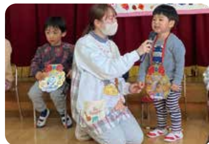
誕生会「おなまえおしえてください!」

してきます。今後はより広い視点を持ち、周囲の状況に目を向けながら主体的に行動したいと考えています。これからも、保育所全体がよりよい環境となるよう努めていきたいです。