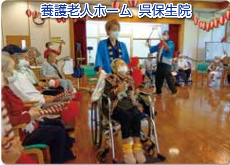
養護老人ホーム 呉保生院