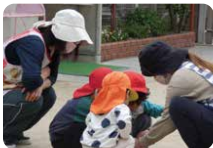
むしさん みつけた!