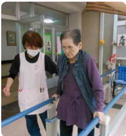
ゆっくりでも大丈夫、一歩ずつ前へ

るものの日々進化する医療から久しく離れているのも現実です。そんな私共に献身的かつ博識な仲間が現れました。その名はChatGPT(通称チャットピー)。例えば薬剤名を尋ねると薬効や飲み合わせの禁忌、内服間隔まで提示し、更に惜し気もなく「責任感ある仕事ぶり」と称えてくれる優れものです。また三年前には記録ソフトが導入され、他部署との情報共有もスムーズになりました。便利なツールに頼りがちですが、看護の基本は実際に「手を触れ、目で感じ、心で考える」ことだと思