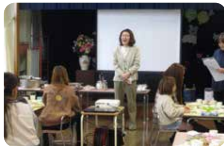
利用者さん全員で食事を兼ねた定例の「母の会」の様子

くれました。インケアの充実はもとより、退所後も地域で孤立することのないよう関係機関との連携を密にしながらアフターケアにも積極的に取り組んでまいります。