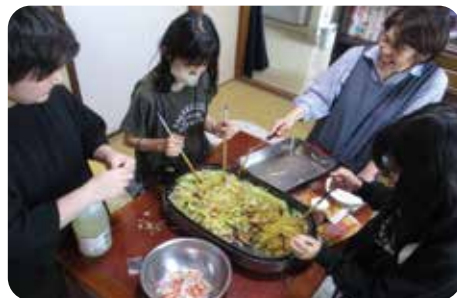
子どもたちと一緒に焼きそばづくりに挑戦

この春、高校を卒業した児童が自立に向けて嶺南荘を巣立ちました。学童期から見守ってきた児童が大きく成長し、新たな一歩を踏み出す姿はとても感慨深く、今後の支援へのさらなる活力を与えて