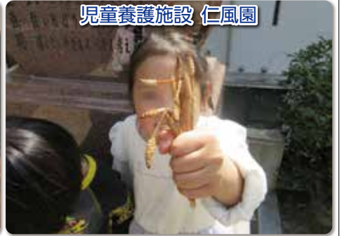
児童養護施設 仁風園