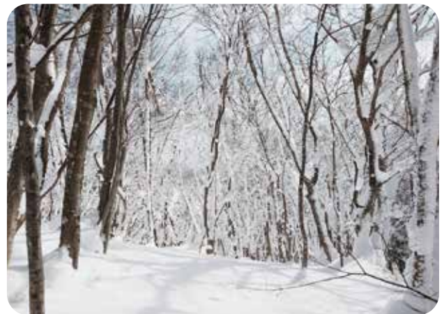
-9℃の世界は寒かった～

ケアマネジャーという仕事は、利用者様やそのご家族の「これから」を支える非常に責任のある仕事です。日々、複雑な課題と向き合い、最適解を模索する中で、頭をフル回転させる時間が続きます。そんな私にとって、登山の魅力は何と云っても「今、この一歩」に集中できることです。重いザックを背負い、急な上り坂を一歩ずつ踏みしめて進む。余計な思考は削ぎ落とされ、心身が自然と同化していくような感覚は、他では味わえない贅沢な時間です。今回、記事に二枚の写真を添えました。一枚は中国地方の最高峰である「百名山・大山」の九合目辺りから、頂上を見上げた風景です。雄大な山容を仰ぎ見た時の感動は今も忘れられません。そしてもう一枚は今年