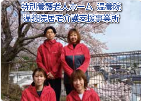
特別養護老人ホーム 温養院 温養院居宅介護支援事業所

経営理念 困っていらっしゃる方のお世話を世に戴く 業務方針 貴方と良かた私と良かたれて全ての皆様が笑いかた感じる社会を目指す 行動目標 笑顔と挨拶、やさしい言葉かけ