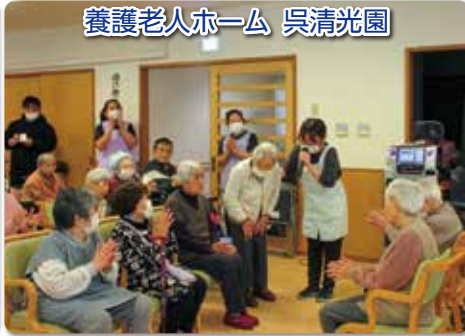
養護老人ホーム 呉清光園