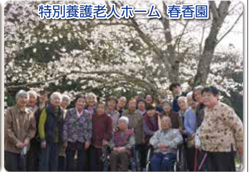
特別養護老人ホーム 春香園