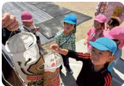
こいのぼりさんげんきに泳いでね

とに挑戦し楽しんでいきます。そんな子どもたちの小さな日々の成長を、保護者の皆様や職員同士で共に喜び合いながら、一日一日を大切にこれからも笑顔で保育したいと思えます。