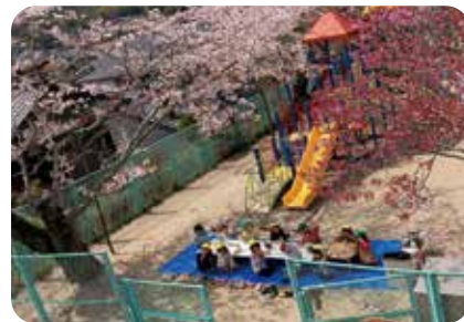
そとでたべるきゅうしょくおいしいね

現在は各クラスの先生方をサポートできる存在になりたいと考えながら、子どもたちの成長や喜びを共に分かち合えることにやりがいを感じています。また職員同士の連携を大切にしながら、日々の保育に繋げていくことの重要性も実感