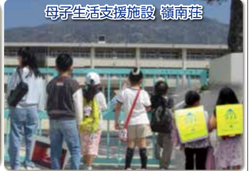
母子生活支援施設 嶺南荘

呉同済義会の法人名は、「困っている方々を等しく救済すること」を使命とする理念に由来しています。 時代の移り変わりとともに社会の価値観や生活様式が変化し、それに伴い社会福祉のあり方も姿を変えてきました。かつては家族や地域が中心となつて生活を支える仕組みが一般的でしたが、核家族化や都市化の進展により、その役割は徐々に行政や専門機関へと移行してきています。近年では、少子高齢化や社会的孤立の深刻化を背景に福祉は「特定の人のための制度」ではなく、誰もが安心して暮らすための社会基盤として位置づけられるようになり、誰もが支え合う「地域共生社会」の重要性が一層高まっています。 このような社会状況において「私たちは、一貫して社会福祉の実現を追求してまいります」というスローガンを掲げております。これは創立以来、変わらない「困っている人のお世話をさせて戴く」という経営理念に基づく、社会福祉実現への揺るぎない姿勢を表明するものです。これからもこの普遍的な理念を胸に刻み、地域社会の皆様とともに、社会福祉の実現に貢献してまいります。