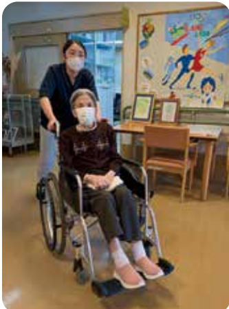
「ご利用者の目線」を第一に車椅子操作を心がけます