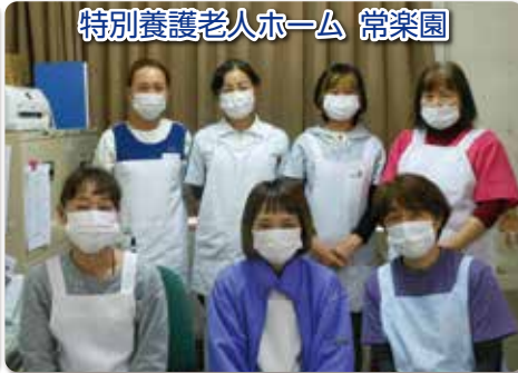
特別養護老人ホーム 常楽園