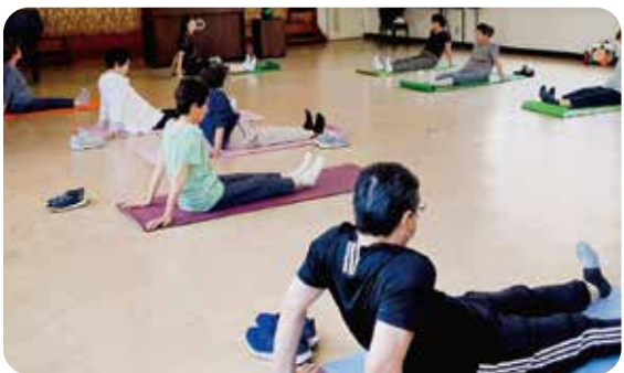
今日の積み重ねが明日の元気に