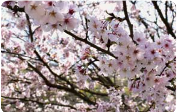
いつもの訪問に、少しだけ春の彩りを

お一人おひとりの思いに丁寧な耳を傾け、その方らしい生活が続くよう、時間をかけて関わることを基本姿勢としていきます。「こんなふうに過ごしたい」「ここが少し不安で…」といったお気持ちや、必要なサービスや専門職につなぎ、安心して過ごせる環境