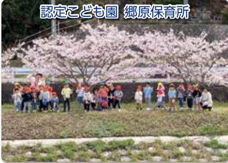
認定こども園 郷原保育所