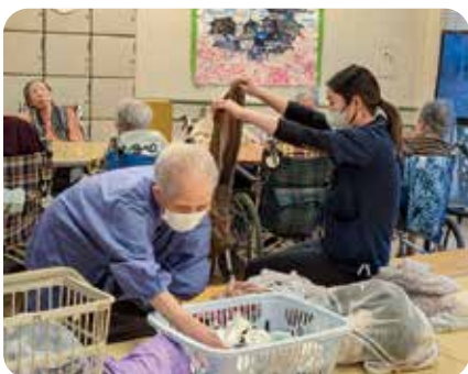
「出来ることは一緒に」を大切にしています

が次の行動に移る際には、必ず声をかけて安心して動いていただけるよう心がけています。まだ学ぶことは多いですが、一つひとつ丁寧に積み重ね、誰からも信頼される職員へと成長していきたいと思えます。