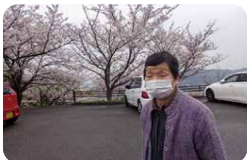
音戸の瀬戸にお花見に来ました

期待と不安に包まれた職員の表情 を、毎年感傷に浸りながらも、温か く送り出しております。異動してい く職員がいれば、異動や新規採用で、 あおぎり荘にいらっしゃる職員もお ります。 我々、あおぎり荘職員一同としま しては、ご利用者様はもちろんのこと、 職員においても、全力で温かく 迎え入れる気持ちでおります。楽し い事、つらい事、さまざまな感情を 共有し、皆でたすけあい、成長して いける職場環境となっております。 経営理念『困っておられる方のお世 話をさせて戴く』の言葉のとおり、 に異動となりました。私はこの春で 呉同済義会に就職し二十二年となり ます。これまでは包括支援センター や居宅 介護支 援事業 所で、 在宅生 活をさ らせて いる高 齢者様 の生活 を支え る仕事