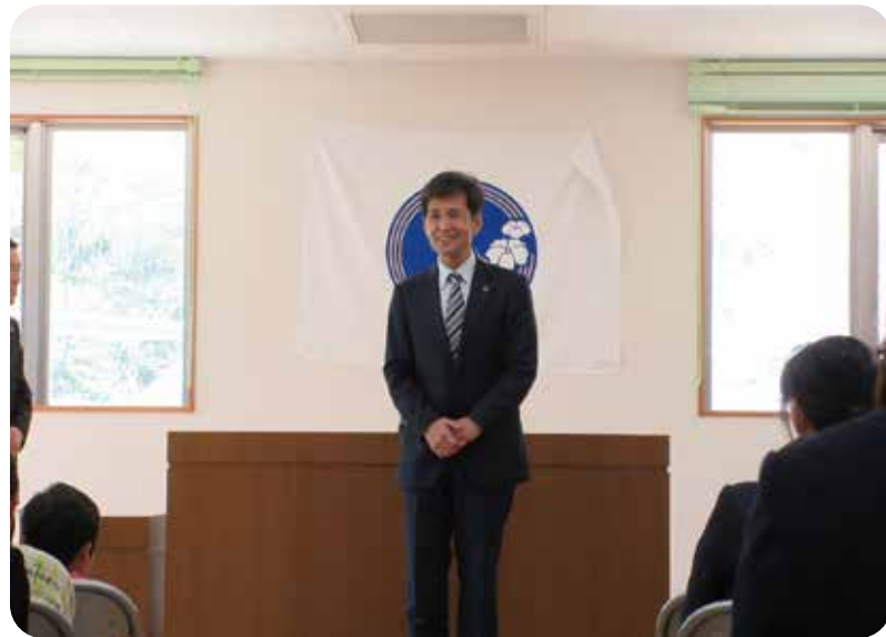
「令和6年度就任式 元気に明るく楽しく！」

仁風園の坂を上り満開の桜とお地蔵さまが迎えて下さいました。明るい丘ホールでの就任式で園児を前にした時に、懐かしさがこみ上げてきました。園児のキラキラした眼を見ながら、仁風園という大きな家族を守っていく重責を感じました。就任の挨拶では「元気で明るく楽しく」をモットーにこれから一緒にと声をかけました。子どもも大人も元気が大切