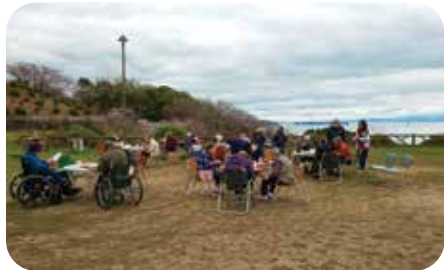
眼下に広がる瀬戸の海、花見の一杯最高です♡

したが、職員さん、ご利用者の皆さんが温かく受け入れてくださりホッとしています。 先日のお花見では桜が満開で天候にも恵まれ、ご利用者の皆さんは久しぶりの野外での食事を楽しまれました。食事の後は呉保生院に戻りカラオケを楽しまれました。私は初めての行事で準備が大変でし