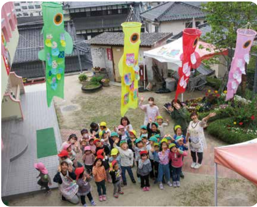
おーい!こいのぼりー!

先日、所庭の桜の下でお花見をしました。つくしやちようちよなど春を見つけながら保育所周辺ののどかな田んぼの周