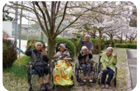
「園庭の桜並木で ハイ!ピース」

お願い致します。昨年の法人合併の異動から、早九か月経過しました。当初から気になっていた園庭の桜並木がやっと満開となり、お花見を楽しみました。入園者様と桜の下で記念撮影、お饅頭を頂き、春の訪れを満喫することが出来ました。 そして、この春には多くの職員が入職し、笑顔・笑声が絶えず、施設内が桜に負けず活気づいております。人の力の素晴らしさを痛感しているところです。また、ご家族の面会も再開し喜んで頂いて