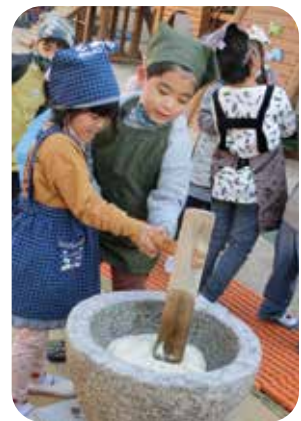
「ぺったん、ぺったん おいしいおもちにな～れ!」

子どもたちの姿を近くで見守っていけることに、保育士としてのやりがいを感じています。一人一人が大切にされ、安心して生活できるよう、子どもたちに寄り添いながら、今年も子どもたちと共に元気いっぱい楽しく過ごしていきたいと思えます。