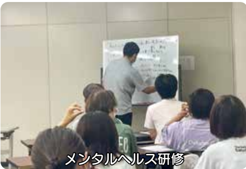
メンタルヘルス研修