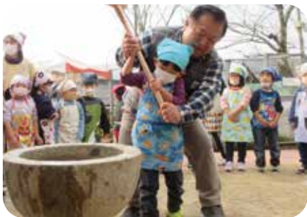
「よいしょ～!ぺったん よいしょ～!ぺったん」

ただき、一緒にお餅をついたり、丸めたりと交流を深めることができました。みんなで作ったお餅が完成した喜びを分かち合いながらおいしく食べ、楽しそうに笑う声が響いていました。そして、一月は、おたのしみ会やお店屋さんごっこなど子どもたちが楽しみにしている行事がたくさんあります。