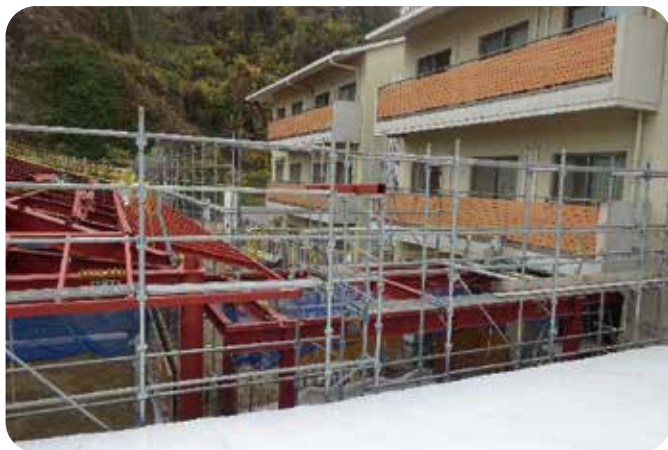
新館完成に向けて進行中