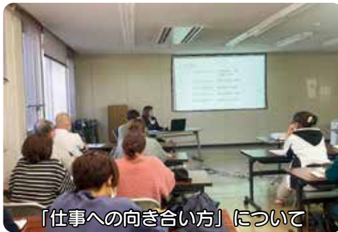
「仕事への向き合い方」について

二つ目は現状を良しとはせず、新たな目標を設定し、それに向かつてチームで取り組む姿勢を醸成すること、三つめは何よりも福祉の原点回帰、人と人が接することの意味を他人