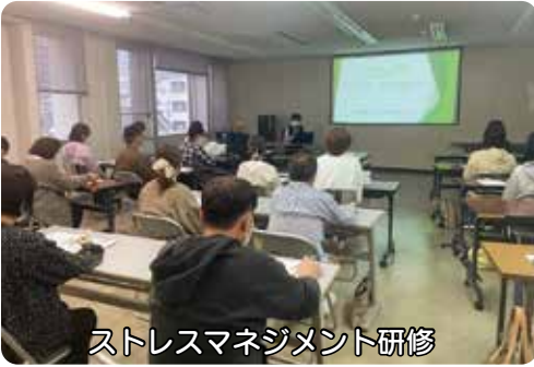
ストレスマネジメント研修