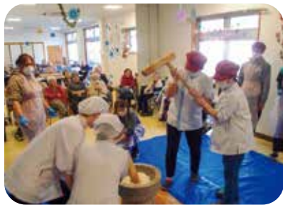
「新年を迎える準備」