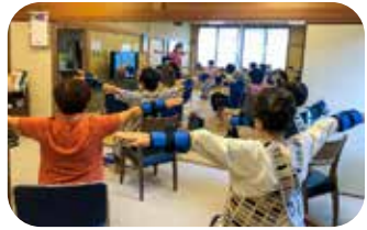
「エンジョイ筋トレ 頑張るま〜す♡」

例年より暖かい日が続く、あつという年の一年だったように思います。二〇二四年、穏やかに新しい年を迎えることができ、気持ちを新たにしているところです。