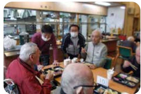
「望年会」 来年も楽しく元気に過ごしましょう！

昨年は、世界が混乱の年でした。皆様も、生活において大変な年、一年を過ごされたと思います。 物価高、インフレの不安など、様々なことがありました。生命の重み、平和の大切さを、心痛いほど感じました。 毎日、大変ですけど、小さな目標を見つけましょう。 つた私は色々な方に支えられ助けられ、ここまで働けていると強く感じています。 今年も新年を迎える前の恒例行事として十二月に餅つきを開催しました。職員一同準備を進め各部署が団結し、利用者様の目の前で昔ながらの餅つきをしています。利用者様も大変喜ばれ餅を搗くたびに歓声上がる程、毎年盛り上がりがあります。 搗きたての餅はその場で利用者様の見守りを行いながら美味しく食べて頂きました。 今後とも様々な行事を