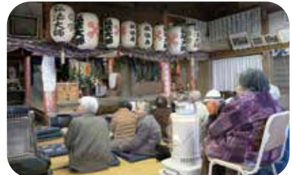
「お接待に感謝感激」

正月を迎えま す。 新年を迎えるにあたり、安浦デイサービスセンターでは毎年、ご利用の皆様へ馬へ願いを書いていたいただき、手作りの鳥居に飾ります。 ご利用の皆様への願いは、「自身の健康」の事や「家族の幸せ」を願う内容が多く、中には「元気でデイサービスに通いたい」という内容のものもあります。 また、年が明けてからは、初詣として地元の神社へ参り、旧年中の感謝を捧げたり、新年の無病息災や平安無事を祈願し