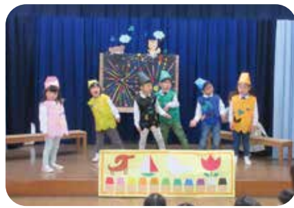
「どんないろがすき～! ぜんぶ!」

私は今年度から嶺南荘保育所の、四歳児クラスの担任となりました。子どもたちは日々の生活の中で喧嘩したり、仲直りをしながら、友だちを思いやったり、相手の思いに気がつくこととする経験を重ねていきます。友だちとの関わりを通して、成長して、成長して