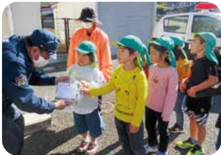
感謝訪問 「いつもありがとうございます!」