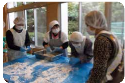
つきたてのお餅、 手際よく丸めて丸めて！