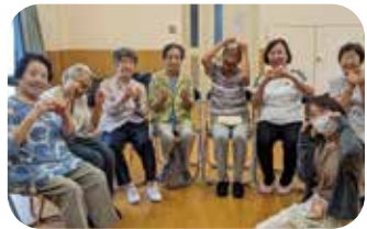
「これくらいの月お弁当に🍱」

宮原・警固屋地域包括支援センターでは高齢者さんの総合相談窓口として様々な業務に取り組んでおり、私は三年前から「地域づくり」と呼ばれる業務を担当しています。