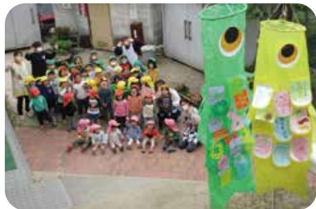
こいのぼりが泳いだよ。オーイ！

の小中学校の入学式に参列させて頂きました。つい数日前まで一緒に過ごしていた一年生たちの凛々しい表情、中学の制服に身を包みたたくましく成長した子どもたちの姿を見て感慨深く思うと同時に、新たな一歩を踏み出した子どもたちへのエールの気持ちでいっぱいになりました。