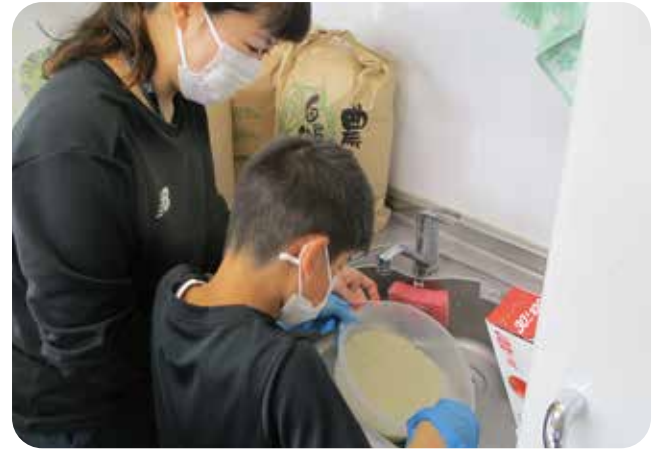
「お米を研ぐ練習をしました！上手に出来たよ。」

ありました。行動制限などの規制を受け、出来ない事でのストレス、コミュニケーションの取り方や行事などの工夫等々学びの連続でした。春は、進学・進級を迎えピカピカと輝く気持ちでのスタートシーズンです。今年こそは利用者の子ども達