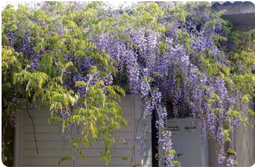
花たちも呉清光園の一員です!

冬の張りつめた空気が少しずつ暖かくなり、また新たな春を迎える事となりました。長いコロナ禍もようやく落ち着きを見せはじめ、園庭では梅、水仙、桜、藤、スズラン草、マーガレットなどが次々と花開き、今年はその様子は美しく輝いて