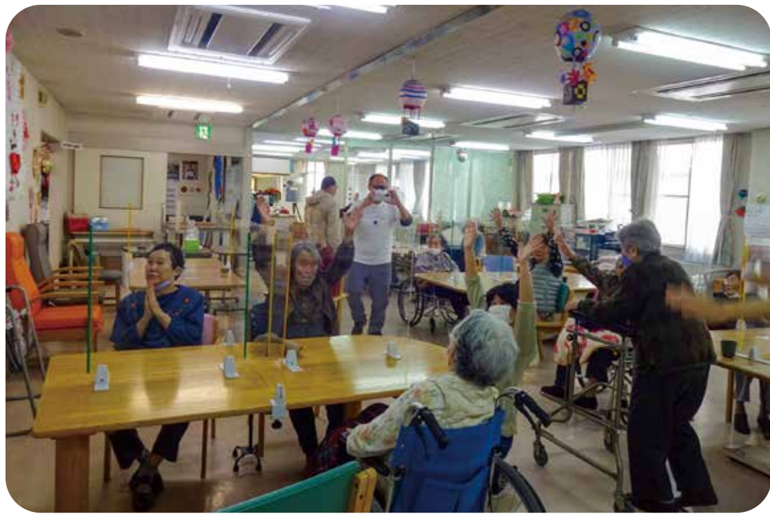
侍ジャパン優勝の瞬間👑

者の「笑顔」だと思えます。新たな所に異動になると、期待と不安がつきものです。一日でも早くご利用者の顔と名前、またデイサービスには送迎サービスも提供しているので自宅の場所も覚えなくてはいけません。このコロナ禍で利用者もマスクを着用されていますので、以前と比べ覚えるのに少し時間がかかっております。しかし常楽園ご利用者、また職員の方の支援のおかげで思ったよりも早いスピードで覚えられています。