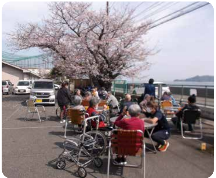
天気がいいので満開の桜の下で コーヒータイム 気持ちいいです。

呉保生院は呉同済義会の施設の中で一番歴史が永く色々な困難もあったそうですが、戦後には皇族の高松宮様のご訪問下さったと記載されています。このような歴史のある呉保生院のスタッフの一員として新年度のスタートを切れ勤務できることをとても嬉しく思っております。 少し前まで満開だった桜は現在、零れ桜・葉桜と景色が少しずつ変化しておりますが、まだ私の心は利用者様から笑顔をいただき「春うらら」のような気持ちで一杯です。