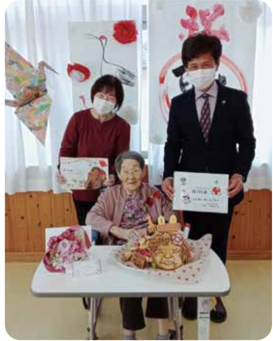
㊦ 百寿お祝い会 ㊦

寮母さんと呼び何もかも手探りで、布おしめの当て方や清拭の方法など試行錯誤の日々と伺いました。その中で大切にしていたのが、どんなに忙しくても笑顔でお世話させて頂く事だったそうです。まさに現在の呉同済義会の行動目標「笑顔と挨拶、やさしい言葉かけ」その