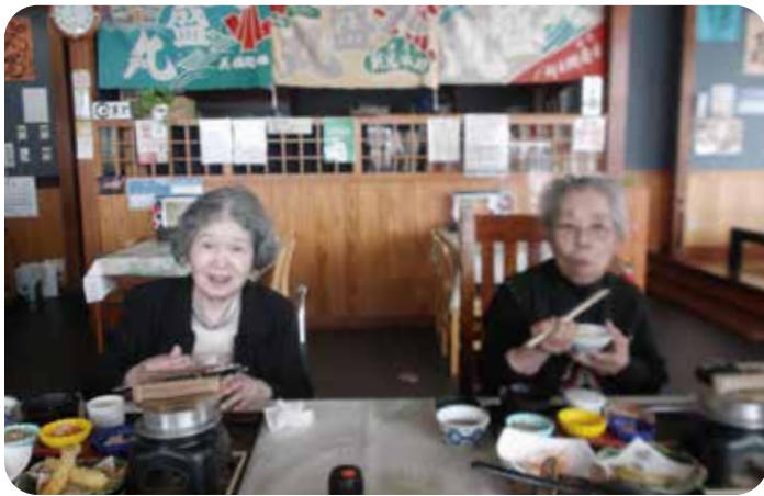
久しぶりの外食 音戸 かつら亭にて頂いています。