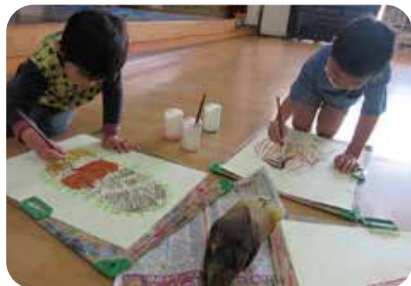
大きなたけのこ！ 緑のところはチクチクしたよ。

私自身もまた、新たな気持ちで新年度を迎えています。職員一人ひとりの子どもたちの気持ちになりました。