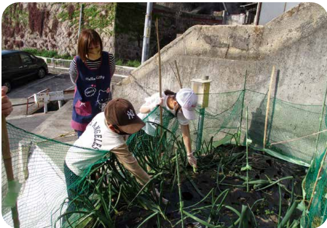
玉ねぎを収穫したよー

私は、母子生活支援施設嶺南荘で母子支援員として利用者の方々と関わらせていただいておりますが、お母さん方と共に、今年もまた子どもたちの成長を身近で見守っていただけることを嬉しく感じています。春は新しく環境が変わる季節でもあります。色々な出会いを大切に、今自分に出来ることを考え、一