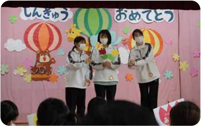
新しい先生といっぱい遊びたいな！

二年ぶりの異動ということもあり、「初めまして！」の出会いのみならず、「久しぶり！大きくなったね！」の再会という子どもも多く、子どもたちの成長ぶりを嬉しく思いながら日々を過ごしています。 その様な中で、ひとりの男の子から小さな手紙をもらいました。そこにはかわいい花と覚えたてのひらがなで「またあそぼうね」と書いてありました。突然のプレゼントに温かい気持ちになり、新たな出会いに感謝の気持ちが芽生えた出来事でした。