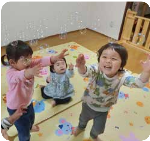
シャボン玉「わ～いっぱい！」

この春、郷原保育所から嶺南荘保育所に異動になり、れいなんそう乳児保育園勤務となりました。不安な気持ちもありましたが、着任してみると、職員の方々は温かく迎えてくださり、また、かわいい子どもたちの笑顔に元気をもらいながら、今で