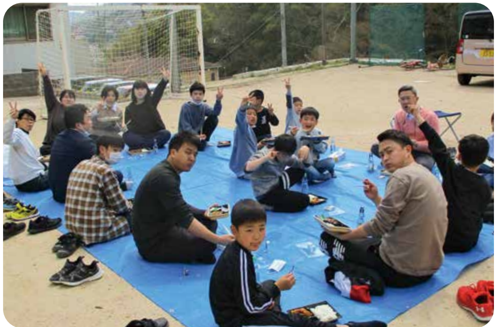
離任式後のお別れ会

でも一番大切だと思うことは、コミュニケーションを取ることで感じています。仁風園へ勤務したばかりの頃、園児たちにどう接していいか分からず、困ったことがあります。園児同士が喧嘩になる場面に遭遇して私が対応できずにいると、先輩の職員さんが園児たちに優しく声をかけました。すると今まで興奮していた園児たちが落ち着き笑顔になった姿を見て、普段からコミュニケーションが取れていることで絆が育まれているのだと強く感じました。 こうしたコミュニケーションを取る上で常に意識してきたいことは、呉同済義会の行動目標である「笑顔と挨拶やさしい言葉かけ」です。一生のうちで一度きりの出会いとなるかもしれない機会に、いがみ合う辛い出会いをするよりも、笑顔で挨拶をし、優しい声かけを心がけていくことにより、清々