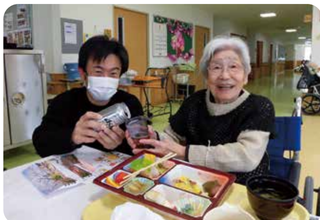
飲みニケーション