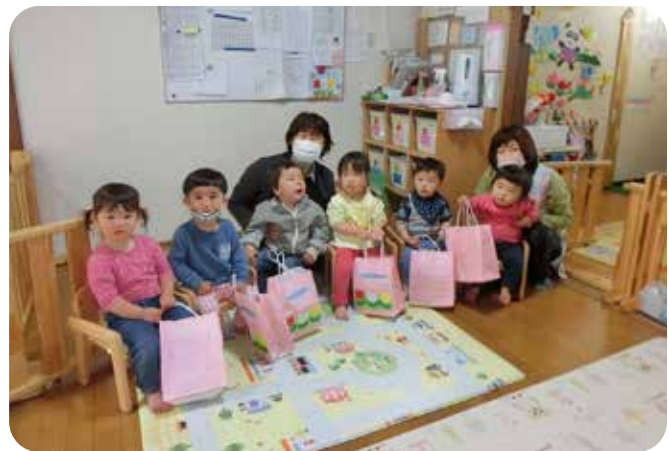
入所式「にゅうしょしんきゅうおめでとう！」

は毎日楽しく保育をしています。平成三〇年十一月に、れいなんそう乳児保育園を広地区に立ち上げ、定員六名でスタートしました。毎年六〜七名の入所があり、広地区は待機児童が多く、地域のニーズに応えるために令和四年四月一日より定員一〇名に引き上げ、認可され、四月は六名でスタートとなりました。家庭的な雰囲気の中で、子どもたちはとてもおびと過ごしています。天気の良い日は近隣の色々な公園へ遊びに行き、季節の花や自然を感じながら散歩したり走り回ったりと、元気いっぱいの子もたち。地