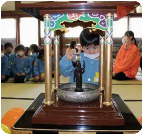
おしゃかさまのたんじょうび

園庭の桜も満開となり、子どもたちの進級をお祝いしているようです。新年度を迎え、新たな一年がスタートしました。子どもたちは、新しい部屋や新しい担任との生活にワクワクとドキドキが入り混じった表情を浮かべながら、毎日元気に登所しています。 四月より、再び郷原保育所で勤務させていただきますことになりました。