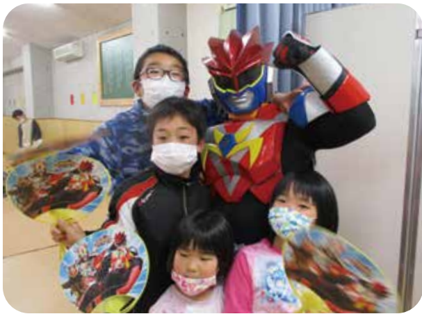
ご当地ヒーロー「メープルカイザー」と一緒に

私が仁風園に勤務して二年目の春を迎えました。私と仁風園との出会いは学生時代に施設実習させていただいた八年前に遡ります。 私は学生時代の施設実習も含めて、仁風園の園児たちと過ごす中で多くのことを学んできました。中