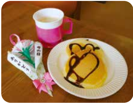
「100年は みんなのおかげ ただ感謝」

当法人百年の歴史に改めて敬意を表したいと思ひます。百年誌制作スタッフとして記念誌の若干の紹介をします。見た目には堅い感じの記念誌です。しかし冷静に一步踏み込んで頂ければ、そこは我が法人が汗と涙と地域の力で育