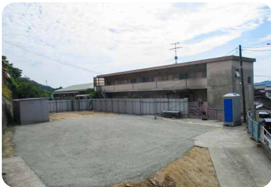
1寮解体後の嶺南荘