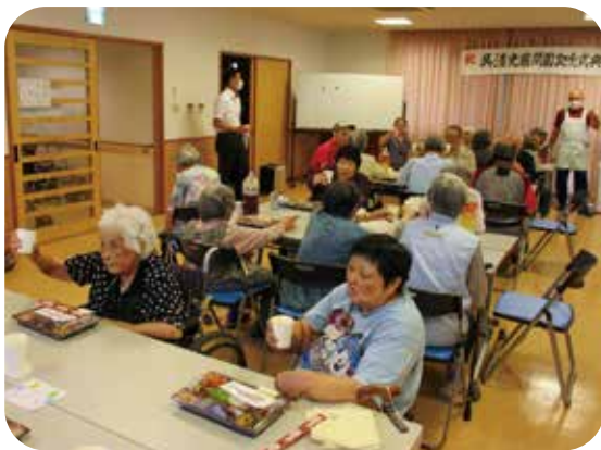
呉清光園創立記念日の食事会「みんなで乾杯!!」

今もなお続くコロナ禍で行事の中止、外出も出来ない等、利用者の皆様の楽しみが以前と比べ少なくなっている状況の中で、少しでも笑顔が増えるよう、園内で感染対策をしっかり行いながら食事会、盆踊りを行ったり、普段あまり食べられないケーキを皆でいただいたりと、できれば喜んで頂けるか考えながら行事に取り組んでいます。