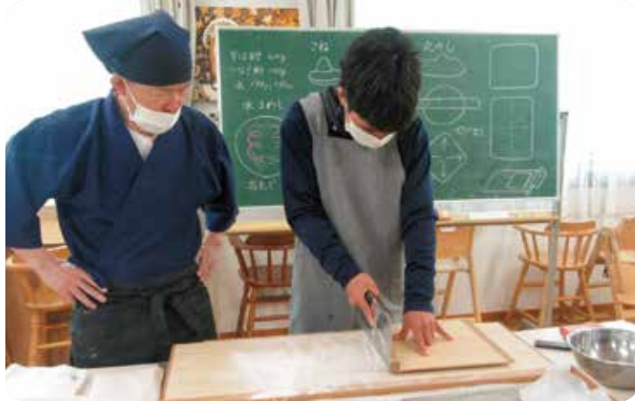
「副園長先生のそば打ち教室」

社会福祉法人 呉同済義会創立百周年を迎え、この法人に入社したことを幸せに思っています。私が、呉同済義会に入社したのは、嶺南荘保育所に保育士として勤