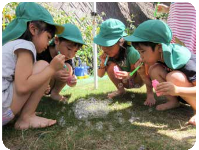
「大きなシャボン玉ができた～!!」

もありですが、「困っておられる方のお世話をさせて戴く」という法人の理念だけは変わらずしっかりと持ち続けたいと思います。