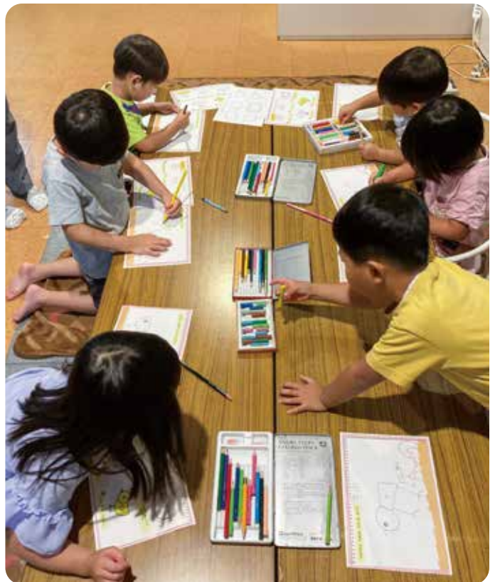
「みんなでおべんきょう」

めさせていた。それが始まりでした。呉同済義会の行動目標「笑顔と挨拶、やさしい言葉かけ」を心がけながら、一人一人の子どものと向き合