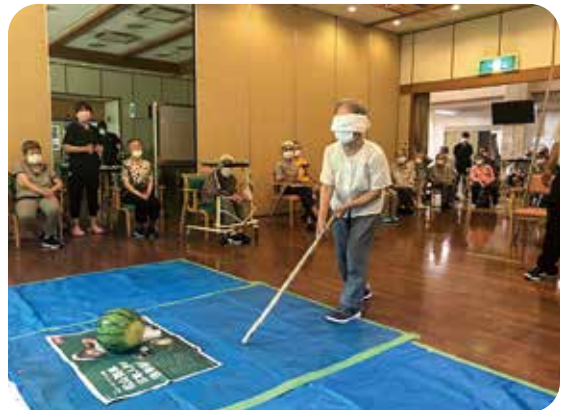
園庭菜園のスイカが今年も豊作でした。スイカ割りを楽しみました。

争・貧困・困窮生活で苦しんでいる方達の救済から始まった呉同済義会を誇りに思います。