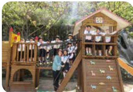
「みんなのなかよしランドでハイ、ポーズ☆」

荘保育所に今度は調理員として戻ってきました。昔の建物が取り壊され、外観はずいぶん様変わりしましたが、いつの時代も変わらないものもありました。それは、子どもたちの元気で明るい笑顔と職員さん達のやさしい対応でした。呉同済義会百周年、時代の変化とともに変わりゆくもの