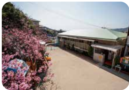
嶺南荘保育所全景