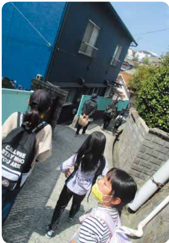
子ども花見の会「通学路を確認したよ〜」