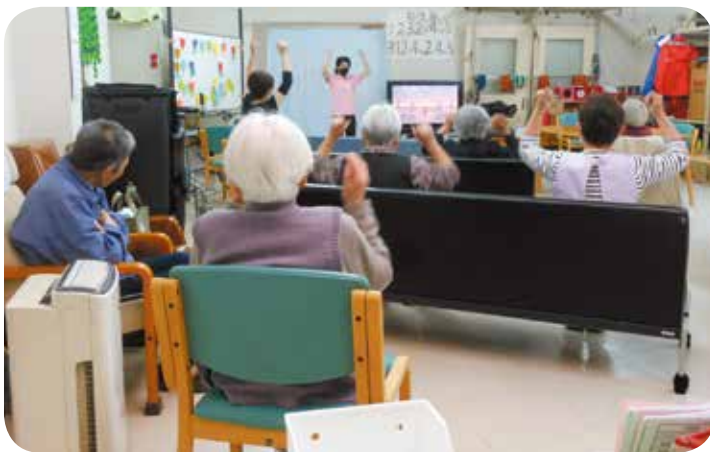
「リハビリ体操はりきってまーす♡」