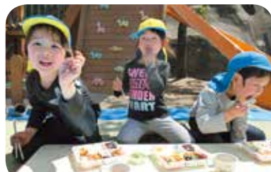
「きゅうしょくせんせいがおべんとうつくってくれたよ!」