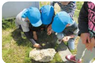
「わあ〜だんごむしみつけた!」

の女の子と一緒に過ごしました。そして、嶺南荘保育所では年中クラス・きぐみさんの担任を任せていただいています。嶺南荘保育所の子どもたちは、小さな身体からは想像がつかない程のパワーに溢れていて、底なしの明るさを持っていま