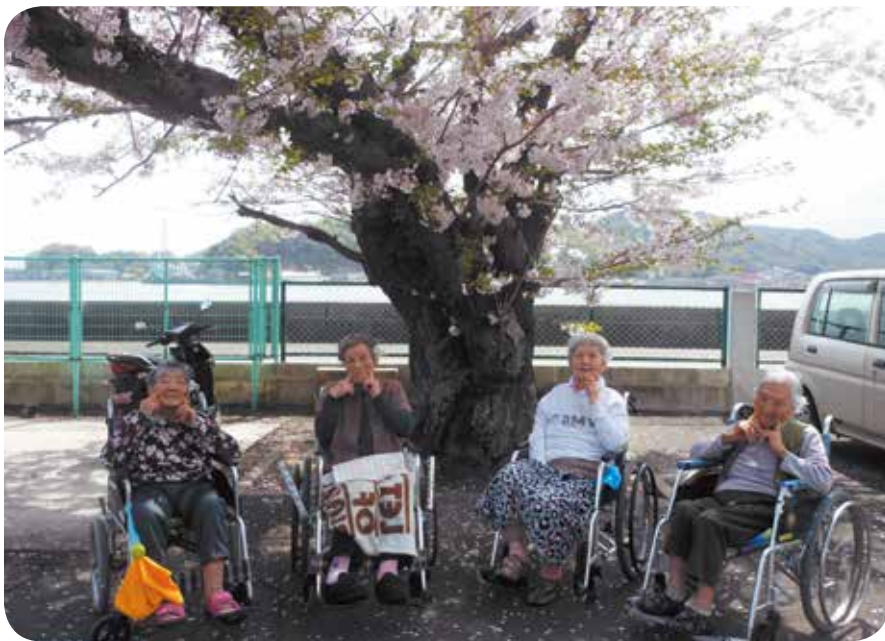
「桜満開で笑顔も映えます」

青々と茂っております。この春に常楽園の副施設長となり、忙しい日々を過ごしております。常楽園では高齢者一人ひとりの状態に合わせた適切なケアを行う個別ケアに力を入れています。一人ひとりを見守り、接し、触れ合う機会を増やし、気持ちを受けとめ、サインを察して、不安・不快・孤独感を少しでも緩和していけるよう取り組んでおります。そのことで職員にも仕事へのやりがいを感じ、チームワークが良くなり離職者も減ってきており、嬉しい限りです。