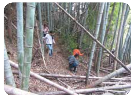
近くの竹林で冒険ごっこ

先の見えない毎日ですが、これまでと変わらず、子どもたちとの一日を大切に過ごし、一緒に前を向いて歩いていきたいと思っています。