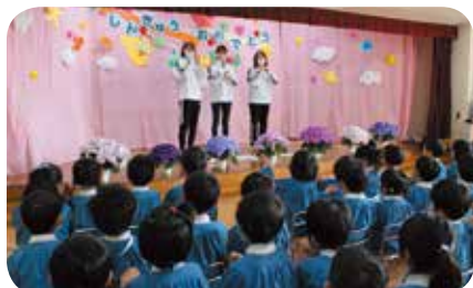
「新しいクラス!ドキドキするけど楽しみだな!」

縮小されたりと、いつもと違う一年間を過ごしてきました。その様なかで、私たち職員は、子どもたちや保護者にとって最善の利益は何かを一番に考え試行錯誤しながら日々保育を行っていきまし