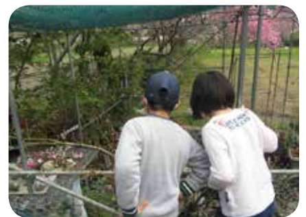
めだかも学校に行ってるね

日々の子どもとの関わりでも、つい悪い事に目が行ってしまいますが、できたことに目を向け、成長を共に喜びあえる関係を築いていきたいと思っています。